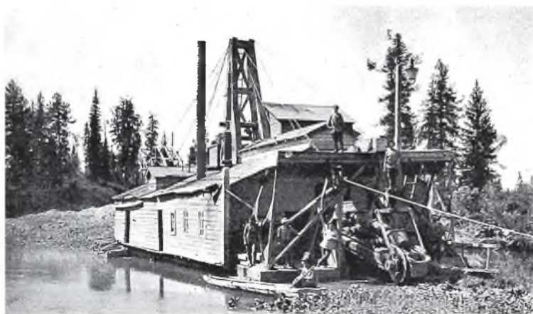
■ Драга на Георгиевском прииске.

Между тем еще в конце XIX века в Кузнецком уезде на кабинетских землях вели добычу 25 компаний и фирм. Самые крупные из них – «Алтайское золотопрмышленное дело» и «Южно-Алтайское золотопрмышленное дело». Государство решило отобрать у них концессию. И вот в 1905 году был подписан договор между Кабинетом и обеими компаниями. По его условиям производилось деление площади на сто частей с ежегодным возвратом пятой части участков в казну. В итоге у каждой