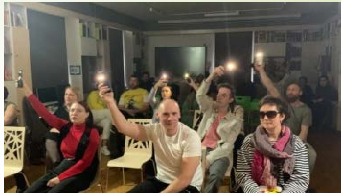
ТВОРЧЕСКИЕ ВЕЧЕРА «ДУШЕВНЫЙ КВАРТИРНИК»