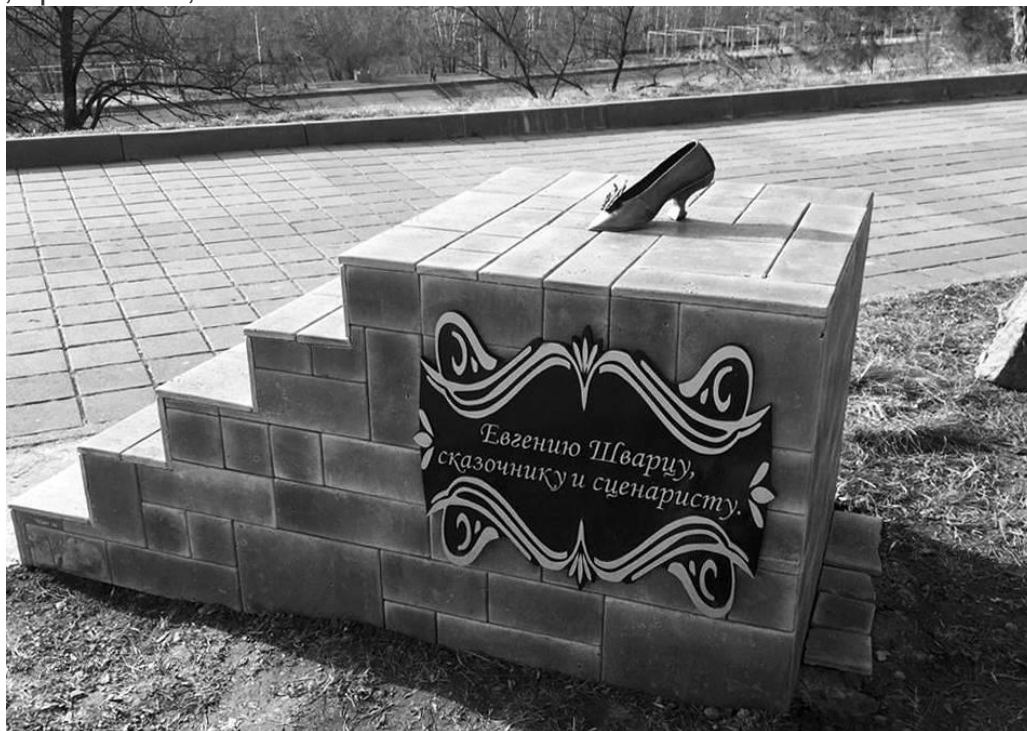
Композиция "Золушкина туфелька" в центральном парке Майкопа.

Жизнь, которая сама по себе утешение, та, что способна утолить все наши печали, просто тем, что она есть.