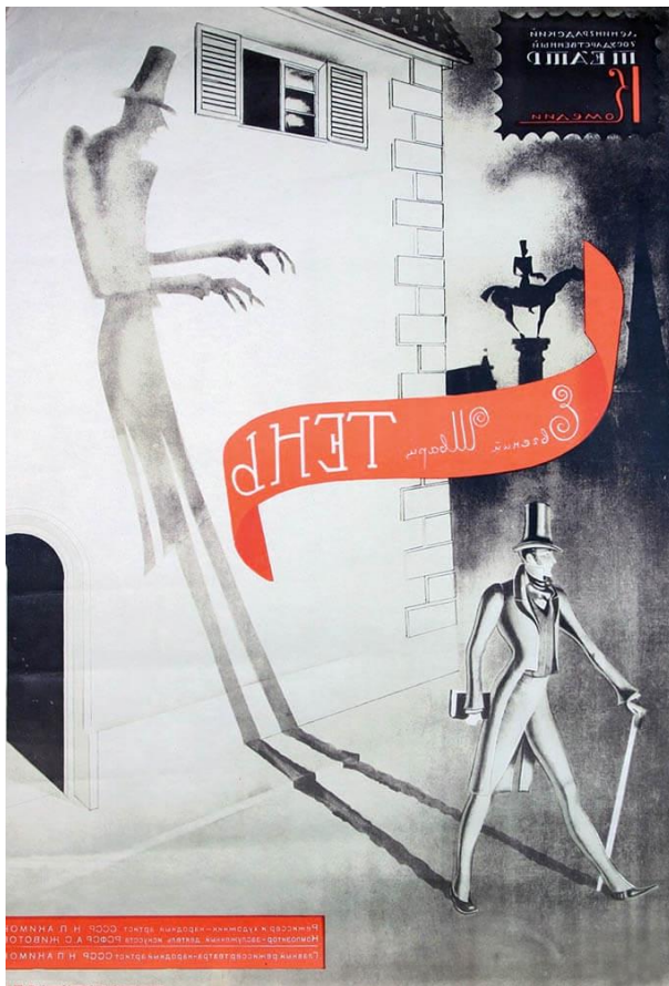
Афиша спектакля "Тень"